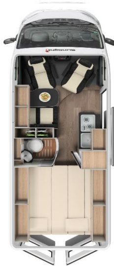
Sunlight Cliff 640 Kastenwagen