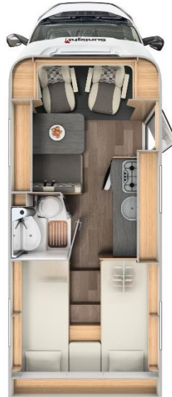
Sunlight T 66 Teilintegriert