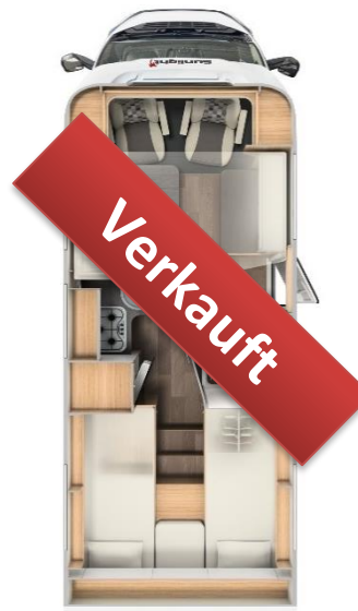
Sunlight T 67 Teilintegriert